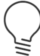
Ανάπτυξη & Ανάλυση Σεναρίων