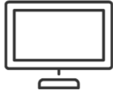
Παρουσιάσεις από Έμπειρα Στελέχη