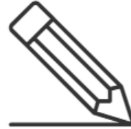
Ατομικές & Ομαδικές Ασκήσεις