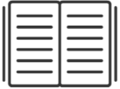
Διαλέξεις από Καθηγητές